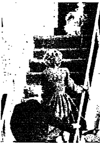
يصعد سلم الطائرة مع زوجته وآل سيقتما كلبهما